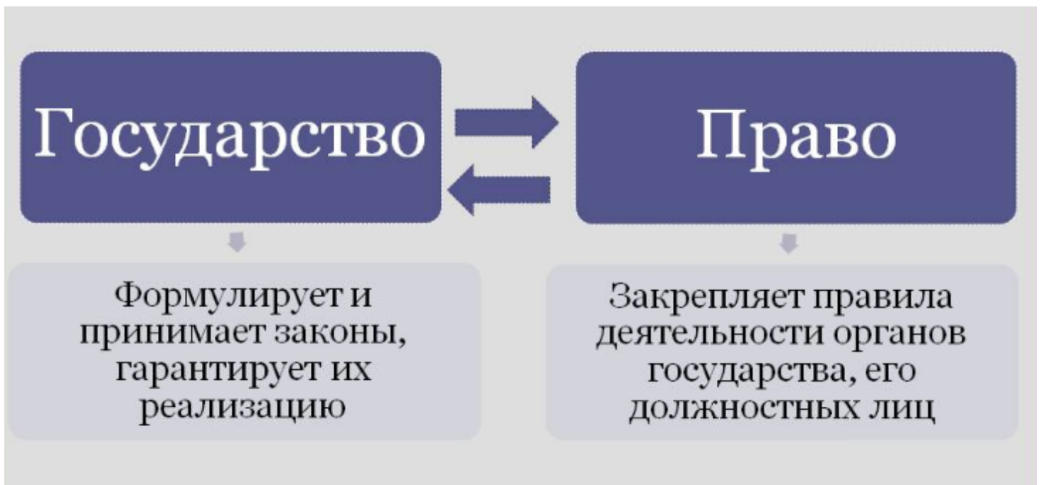
Рис. 1. Взаимосвязь государства и права